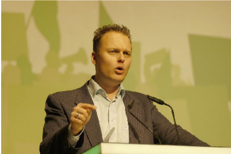
Kai Gehring bei seiner Rede auf der Landesdelegierten-konferenz in Krefeld

Gehring bedankte sich für die Unterstützung des Essener Kreisverbandes, das Ver-trauen der NRW-Delegierten und freut sich auf einen spannenden Bundestagswahl-kampf im nächsten Jahr.