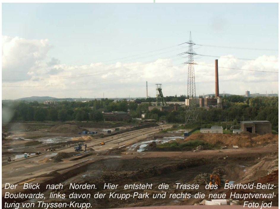
Der Blick nach Norden. Hier entsteht die Trasse des Berthold-Beitz-Boulevards, links davon der Krupp-Park und rechts die neue Hauptverwaltung von Thyssen-Krupp.