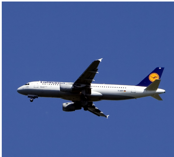
Flugzeug im Landeanflug-lizenzfreies

Die Beschwerden wegen der damit verbundenen Störungen der Nachtruhe haben auch aus Essen in der letzten Zeit stark zugenommen. Der Verein Bürger gegen Fluglärm registriert immer mehr Verstöße gegen die Nachtflugregelung,