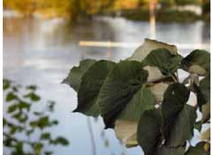
Ruhrhochwasser - unser Trinkwasser spült so manches mit sich

Um gesundheitliche Risiken für die Essener Bevölkerung auszuschließen, ist eine Nachrüstung der Wassergewinnungsanlage in Essen mit einer vergleichbaren Reinigungsleistung wie Mülheim oder Düsseldorf dringend erforderlich, um PFT, Flammenschutzmittel und Medi-